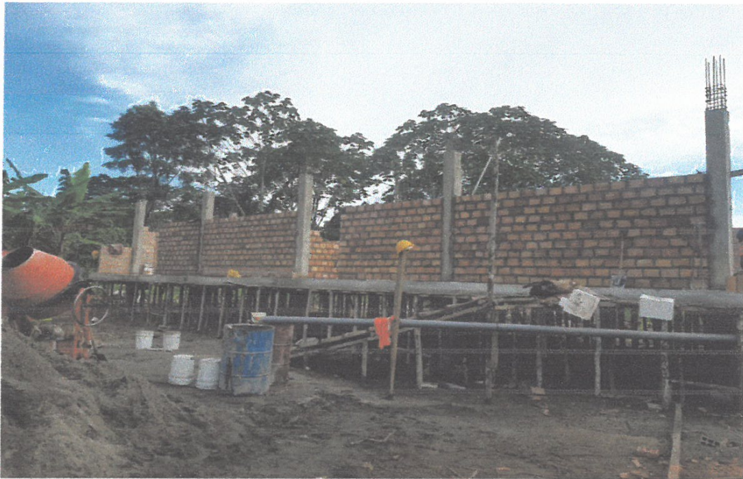
FOTO N°07: EN LA FOTO, se muestra la vista panorámica del estado de la obra

CONSORCIO ATENAS 2020 [Signature] ING. ALBERTO VAN ALVAN RIVAS APODERADO COMÚN