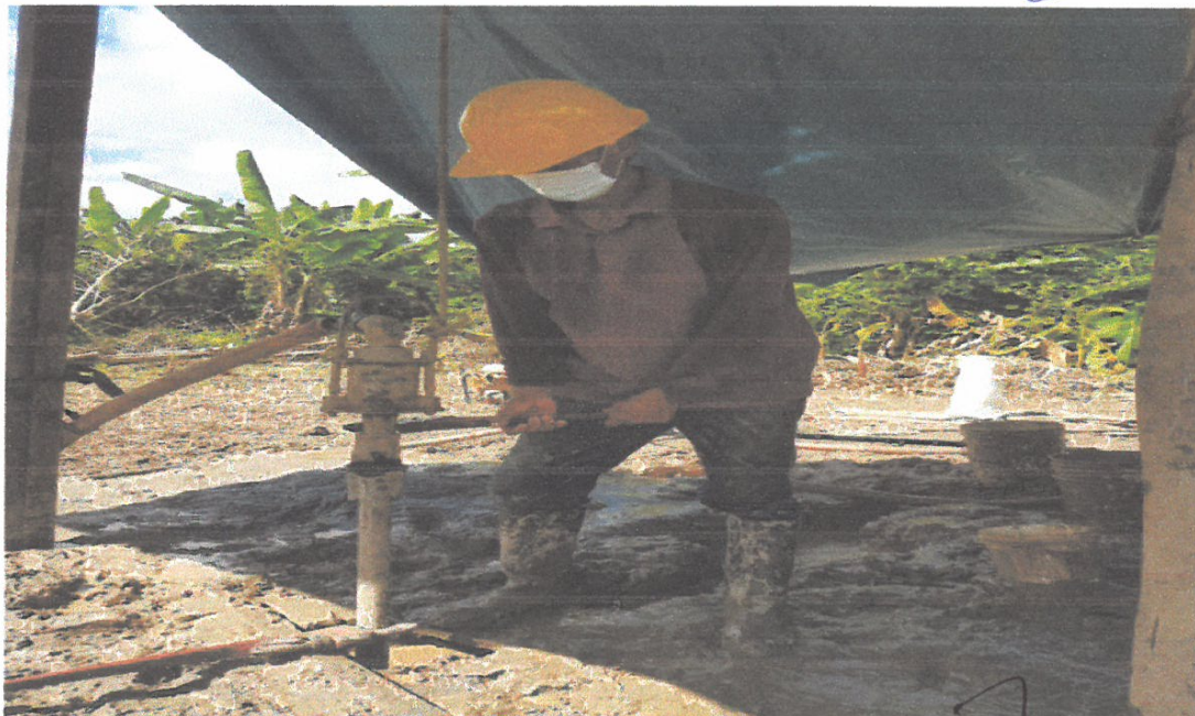
FOTO N°08: se muestra trabajos de perforación del pozo artesiano de gua para institución educativa